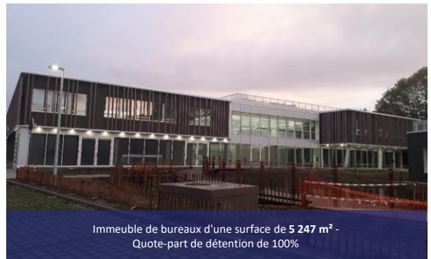
Immeuble de bureaux d'une surface de 5 247 m 2 - Quote-part de détention de 100%