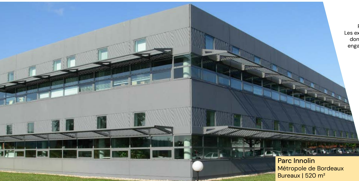
Parc Innolin Métropole de Bordeaux Bureaux | 520 m 2

1 Le TOP (Taux d'occupation physique) se détermine par la division de la surface cumulée des locaux occupés par la surface cumulée des locaux détenus par la SCPI. 2 Le TOF (Taux d'occupation financier) se détermine par la division du montant total des loyers et indemnités d'occupation facturés ainsi que des indemnités compensatrices de loyers par le montant total des loyers facturables dans l'hypothèse où l'intégralité du patrimoine de la SCPI serait louée.