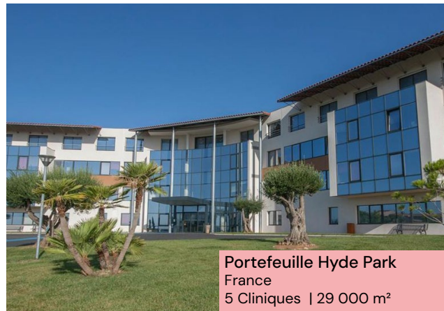
Portefeuille Hyde Park France 5 Cliniques | 29 000 m²

LF Avenir Santé investit dans des zones dynamiques en France & en Europe . Avec une équipe dédiée alliant expertise, sélectivité et gestion durable des immeubles, elle vise à se constituer un patrimoine composé d'actifs immobiliers en lien avec le secteur médico-social allant des soins du quotidien (maison de santé, clinique...) aux besoins générationnels (crèche, résidence senior...). À l'investissement, elle sélectionne les actifs en fonction des critères suivants :