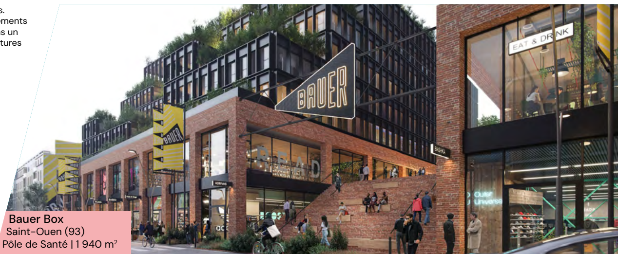
Bauer Box Saint-Ouen (93) Pôle de Santé | 1 940 m²

Le Label ISR ne garantit pas la performance financière du fonds.