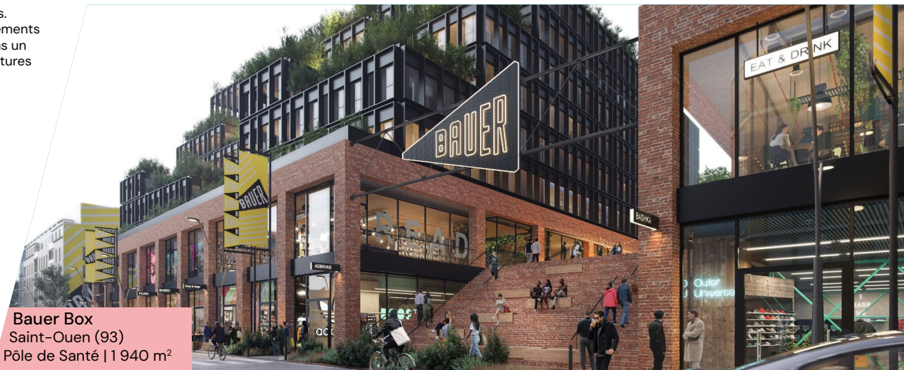
Bauer Box Saint-Ouen (93) Pôle de Santé | 1 940 m²

Le Label ISR ne garantit pas la performance financière du fonds.