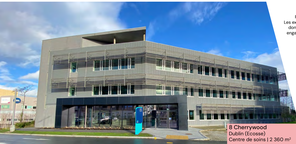
8 Cherrywood Dublin (Ecosse) Centre de soins | 2 360 m 2

1 Le TOP (Taux d'occupation physique) se détermine par la division de la surface cumulée des locaux occupés par la surface cumulée des locaux détenus par la SCPI. 2 Le TOF (Taux d'occupation financier) se détermine par la division du montant total des loyers et indemnités d'occupation facturés ainsi que des indemnités compensatrices de loyers par le montant total des loyers facturables dans l'hypothèse où l'intégralité du patrimoine de la SCPI serait louée.