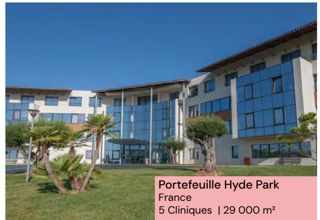
Portefeuille Hyde Park France 5 Cliniques | 29 000 m²

LF Avenir Santé investit dans des zones dynamiques en France & en Europe . Avec une équipe dédiée alliant expertise, sélectivité et gestion durable des immeubles, elle vise à se constituer un patrimoine composé d'actifs immobiliers en lien avec le secteur médico-social allant des soins du quotidien (maison de santé, clinique...) aux besoins générationnels (crèche, résidence senior...). À l'investissement, elle sélectionne les actifs en fonction des critères suivants :