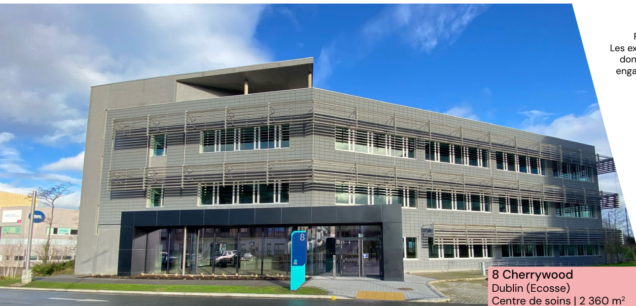
8 Cherrywood Dublin (Ecosse) Centre de soins | 2 360 m 2

1 Le TOP (Taux d'occupation physique) se détermine par la division de la surface cumulée des locaux occupés par la surface cumulée des locaux détenus par la SCPI. 2 Le TOF (Taux d'occupation financier) se détermine par la division du montant total des loyers et indemnités d'occupation facturés ainsi que des indemnités compensatrices de loyers par le montant total des loyers facturables dans l'hypothèse où l'intégralité du patrimoine de la SCPI serait louée.