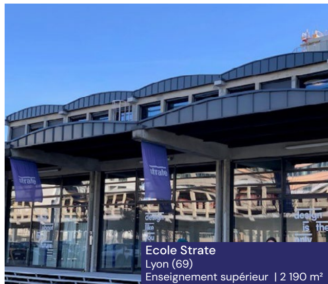
Ecole Strate Lyon (69) Enseignement supérieur | 2 190 m 2

Avec une plateforme européenne de professionnels de l'immobilier , permettant une sélection fine immeubles et des locataires, la SCPI vise à se constituer un patrimoine composé de bureaux, de commerces et de locaux d'activités ou d'entrepôts, mais également de typologies innovantes telles que la santé, l'hôtellerie ou encore le résidentiel géré (étudiant, senior, coliving) en France et dans des Etats qui ont été membres ou qui sont membres de l'Union Européenne.