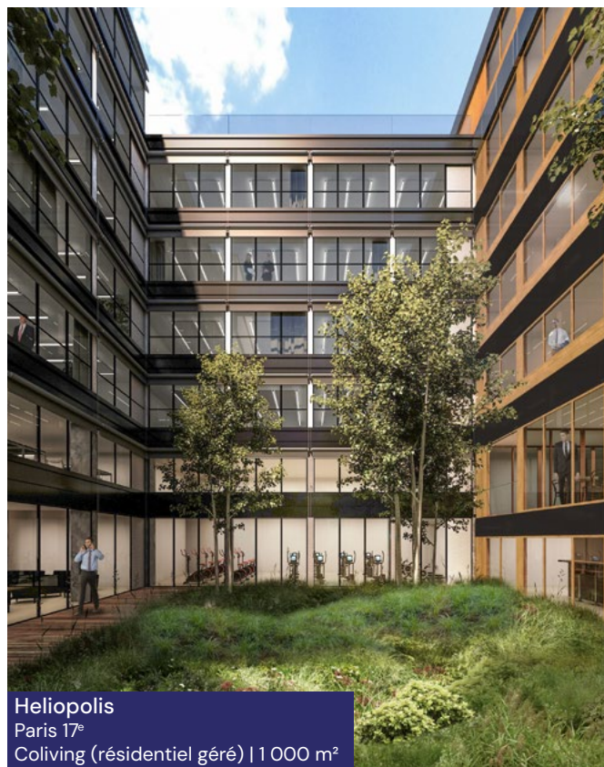
Heliopolis Paris 17 e Coliving (résidentiel géré) | 1 000 m 2