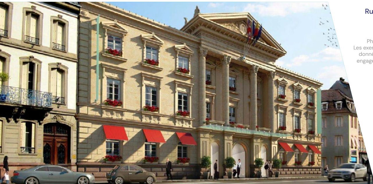
Rue de la Nuée Bleue Strasbourg (67) Hôtellerie | 6 665 m 2

Source des données de la SCPI - La Française: 31/12/2024. 1 La SCPI est détentrice de parts d'une société civile immobilière (SCI), propriétaire des ensembles immobiliers présentés. 2 Le taux d'occupation physique (TOP) se détermine par la division de la surface cumulée des locaux occupés par la surface cumulée des locaux détenus par la SCPI. 3 Le taux d'occupation financier (TOF) se détermine par la division du montant total des loyers et indemnités d'occupation facturés ainsi que des indemnités compensatrices de loyers par le montant total des loyers facturables dans l'hypothèse où l'intégralité du patrimoine de la SCPI serait louée.